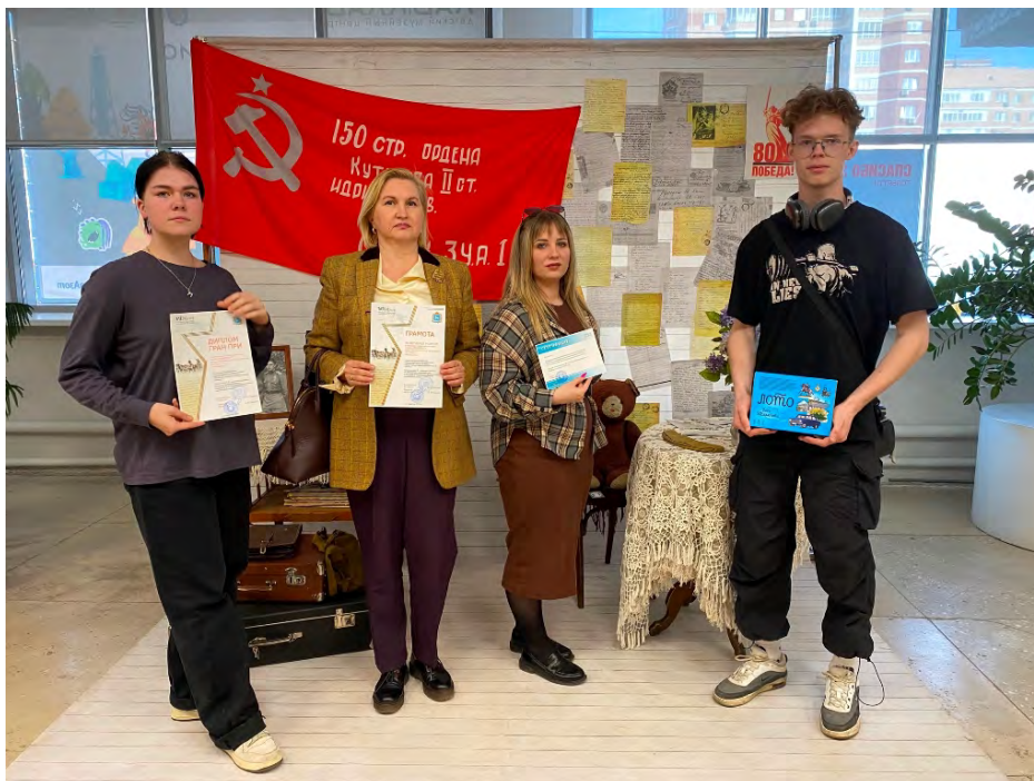
Победители конкурса «МУЗЕЙФЕСТ»

Приз музейного жюри был вручен Тольяттинскому индустриально-педагогическому колледжу. Учитывая положительный опыт проведения, конкурс решено продолжить и в 2026 году. С января 2026 года стартует новый «МУЗЕЙФЕСТ», посвящённый истории развития города и формированию системы профессионального образования.