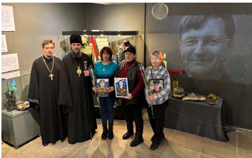
Раздел «Память» на выставке «2022. От первого лица»