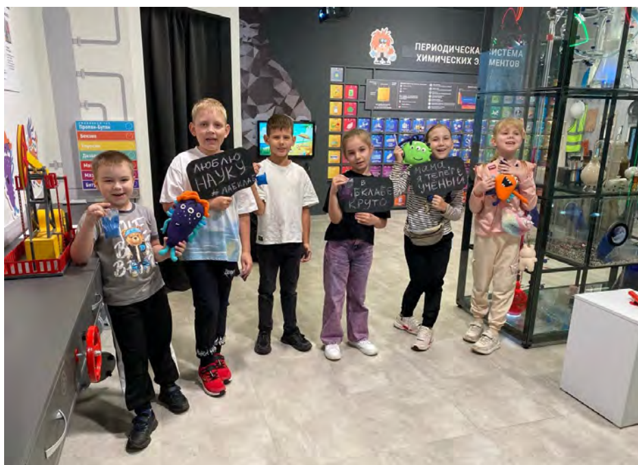
Посетители детского музейного центра «ЛабКлаб»

Отдельным достижением стала новая программа для малышей «Нам годик», созданная к первому дню рождения ДМЦ «ЛабКлаб» для аудитории от полутора лет. Немногие музеи готовы работать с аудиторией от трёх лет, один из успешных примеров – музей «Зелёнка» (г. Самара). Тольяттинский краеведческий музей начал работу в данном направлении – нижняя возрастная планка посетителей нашей программы для малышей – 1,5 года. Это смелая инициатива музейных педагогов, требующая особого подхода и виртуозного знания возрастных особенностей раннего дошкольного возраста и умения выстраивать коммуникацию и с детьми, и с их родителями.