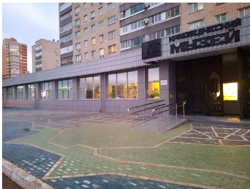
Карта города Тольятти. Входная зона музея. Проект осуществлён в рамках государственной программы «Народный бюджет Самарской области»

В рамках национального проекта «Семья» в 2025 году закуплен мобильный комплект экскурсионной радиосистемы. Использование радиогидов на экскурсиях музея повышает качество обслуживания, позволяет в комфортной для посетителей обстановке проводить экскурсии по экспозициям и выставкам музея, экскурсии по городу.