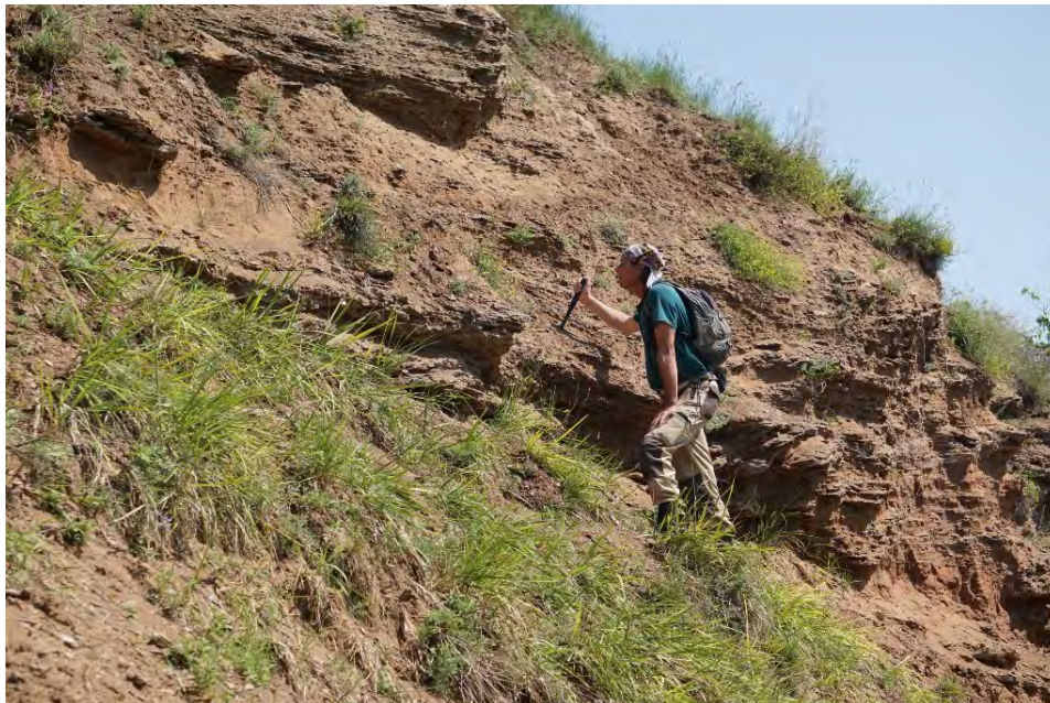
Ежегодная научная экспедиция по мониторингу триаса