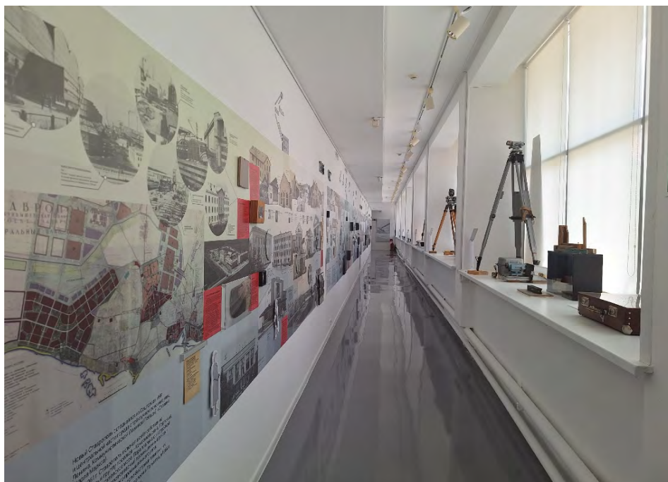
Новое экспозиционно-выставочное пространство «Переход» в экспозиции «20 век: Ставрополь-Тольятти»