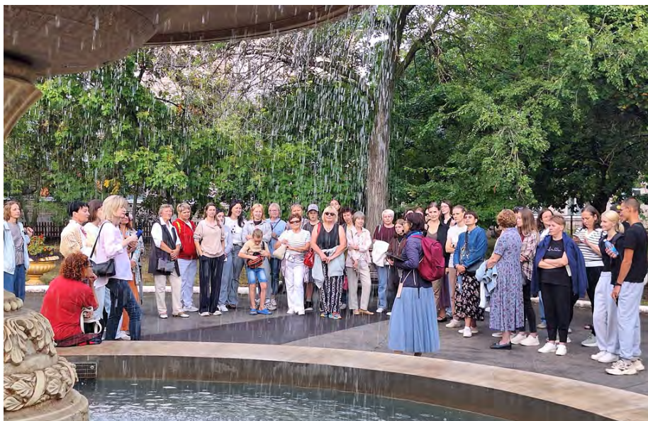
Пешеходная экскурсия по Портпосёлку «Сердце города»

по Соцгороду, 4 – по Портпосёлку, 4 – по району УНР, 3 – по Комсомольскому району, 4 – по микрорайону Шлюзовому, 3 – по Автозаводскому району, 6 – по центру Центрального района. Пешеходные экскурсии посетило более 400 человек. В отчётном году было проведено 4 автобусные экскурсии по городу, которые посетили около ста человек.