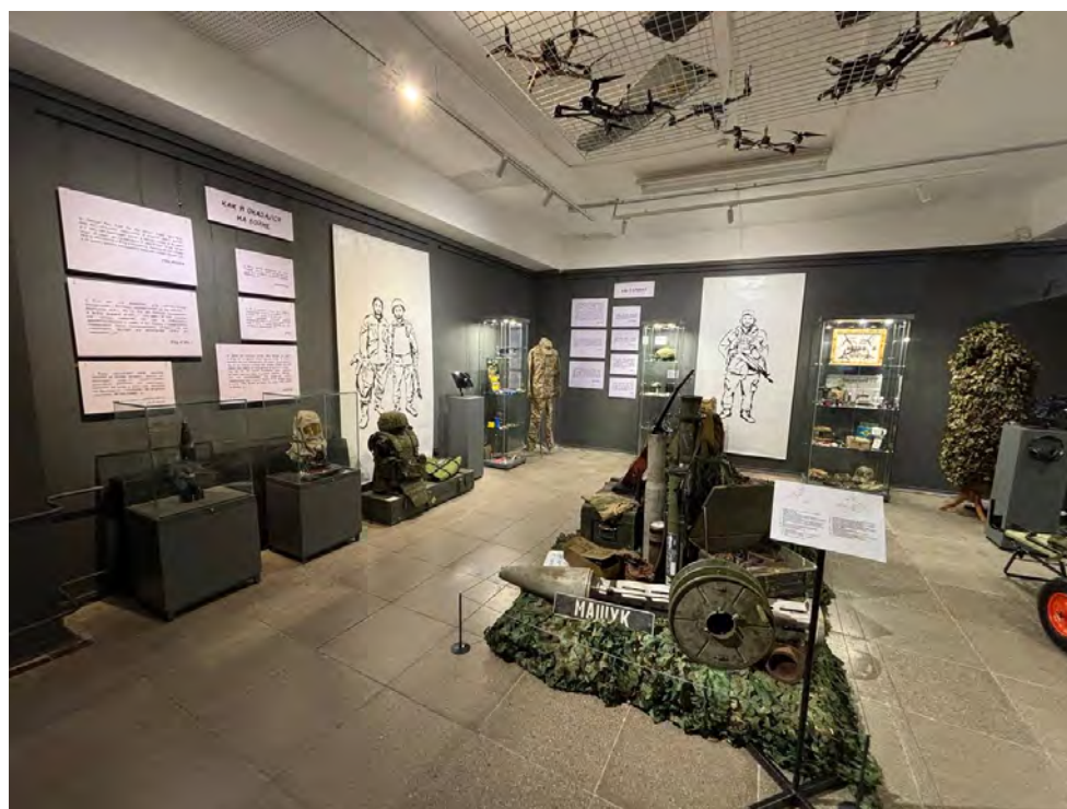
Выставка «2022. От первого лица». Посвящается тольяттинцам – участникам специальной военной операции и их семьям

4. В августе 2025 года открыта выставка «Дорога к Храму» – совместная выставка Тольяттинской епархии и музея, которая стала частью большой и планомерной работы по изучению и сохранению православной истории Ставрополь-Тольятти и Самарского региона. Выставка приурочена к 50-летию Преосвященного Нестора, епископа Тольяттинского и Жигулёвского. Реализация проекта проходит в год трёхсотлетия миссионерской деятельности Русской Православной Церкви в нашем крае. Культурно-просветительной целью проекта является популяризация духовно-нравственных ценностей. Экспозиция подготовлена при личном участии Владыки Нестора. В числе предметов экспозиции – старинные иконы и раритетные издания из личной коллекции архиерея. Интерактивный стол с дополнительными материалами позволяет глубже познакомиться с тематикой экспозиции.