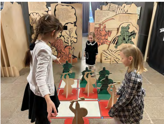
Интерактивные элементы на выставке Государственного музея-заповедника «Куликово поле»