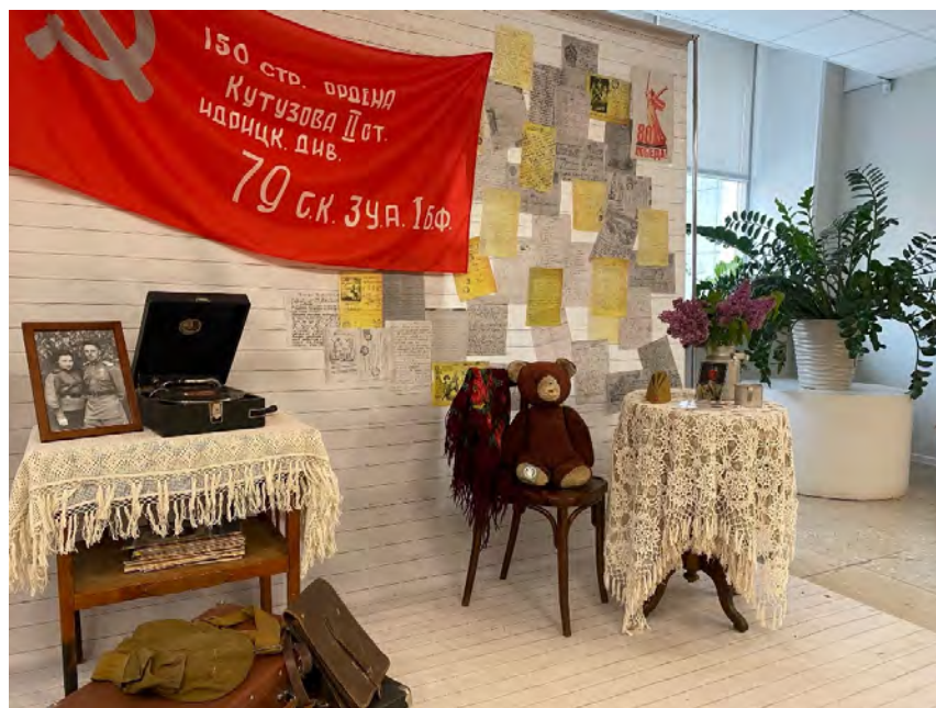
Фотозона ко Дню Победы