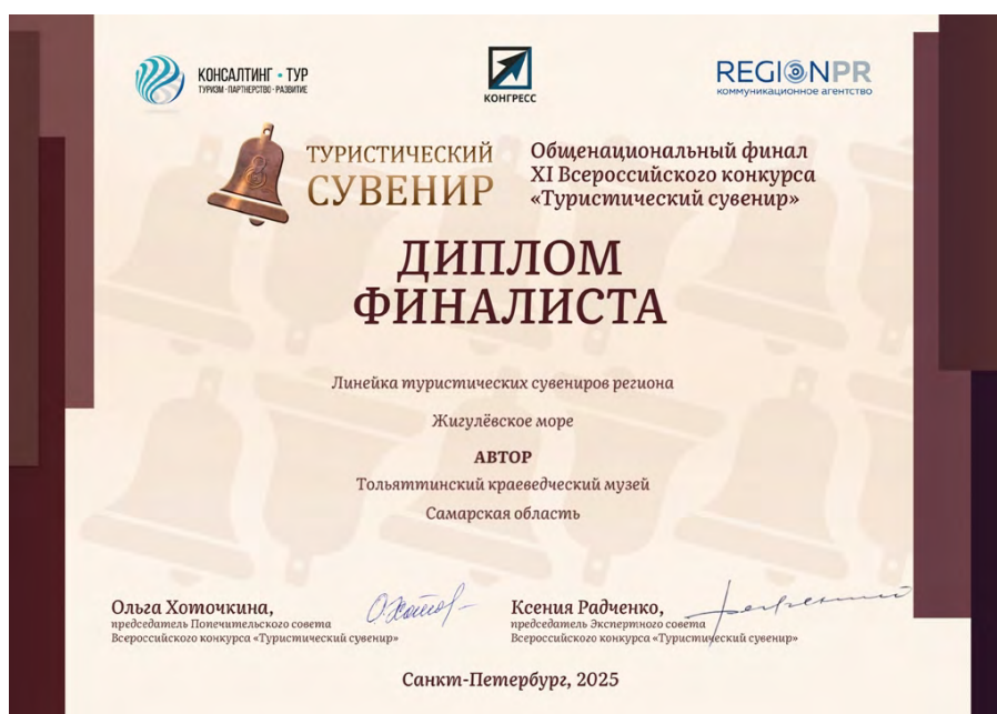
Участие музея с линейками сувенирной продукции во всероссийском конкурсе

В 2025 году сувенирная продукция музея была представлена в конкурсе «Туристический сувенир Самарской области». От музея было подано 5 заявок в 5 номинаций, все заявки стали финалистами конкурса. Финал конкурса состоялся 2 июля 2025 года в Самаре. Итогом участия музея стали три первых места и одно второе. Первые места в своих номинациях заняли: сувенирная линейка «Жигулёвское море», салфетка настольная «История Тольятти», набор (открытка и магнитные закладки) «Знаменитые люди в Ставрополе-Тольятти». Второе место – часы настенные «Радость труда. Сейчас самое время». Организаторы конкурса: коммуникационное агентство Region PR, ООО «Консалтинг-Тур» и Туристский информационный центр Самарской области. Победившие в региональном этапе конкурса сувенирные линейки краеведческого музея вошли в список финалистов Общенационального финала XI Всероссийского конкурса «Туристический сувенир» (Санкт-Петербург, декабрь 2025 года).