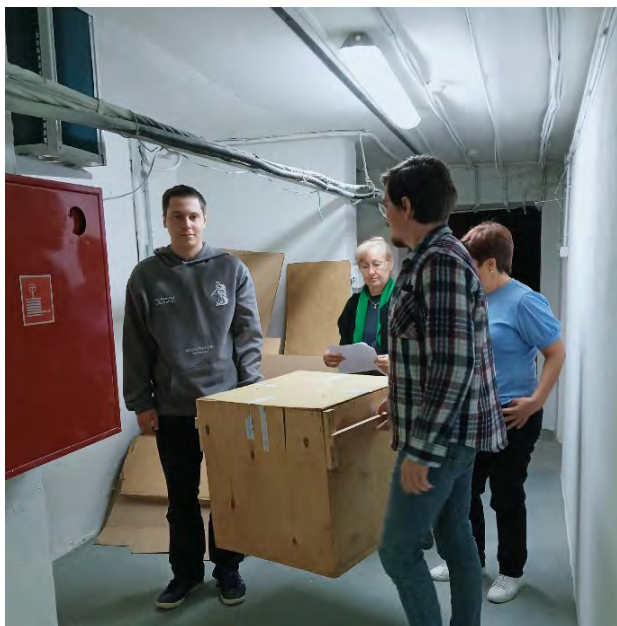
Ежегодная тренировка по эвакуации музейных ценностей

Согласно требованиям по пожарной безопасности была проведена перезарядка огнетушителей, проведены проверки внутреннего противопожарного водопровода на исправность и водоотдачу, приобретены дополнительные огнетушители.