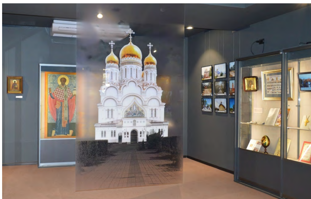
Совместная выставка Тольяттинской епархии и Тольяттинского краеведческого музея «Дорога к Храму»

В рамках выставочной деятельности Тольяттинский краеведческий музей в 2025 году продолжил работу над созданием и привлечением юбилейных выставок и выставочных проектов, приуроченных к краеведческим и историческим событиям.