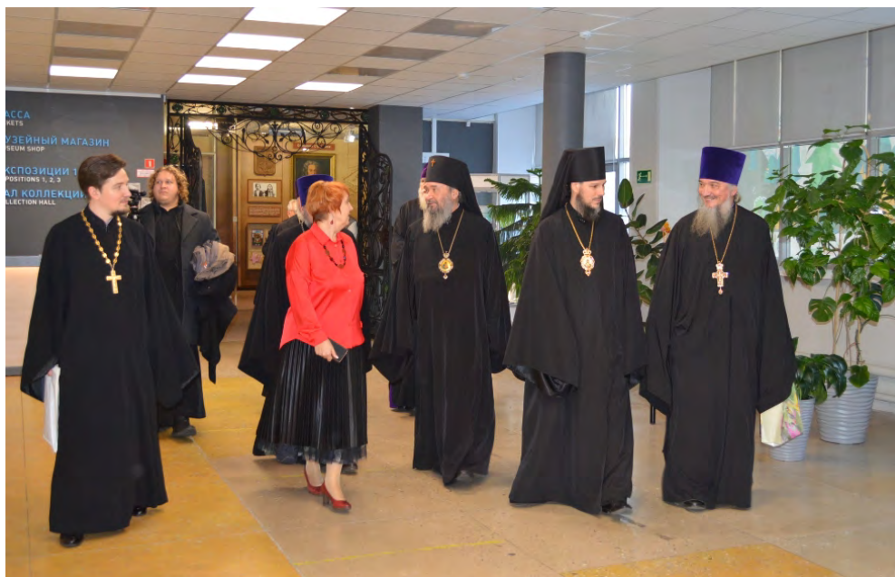
Встреча архиепископа Элистинского и Калмыцкого Юстиниана в рамках посещения города Тольятти делегацией из Республики Калмыкия, 13-14 ноября 2025 г.