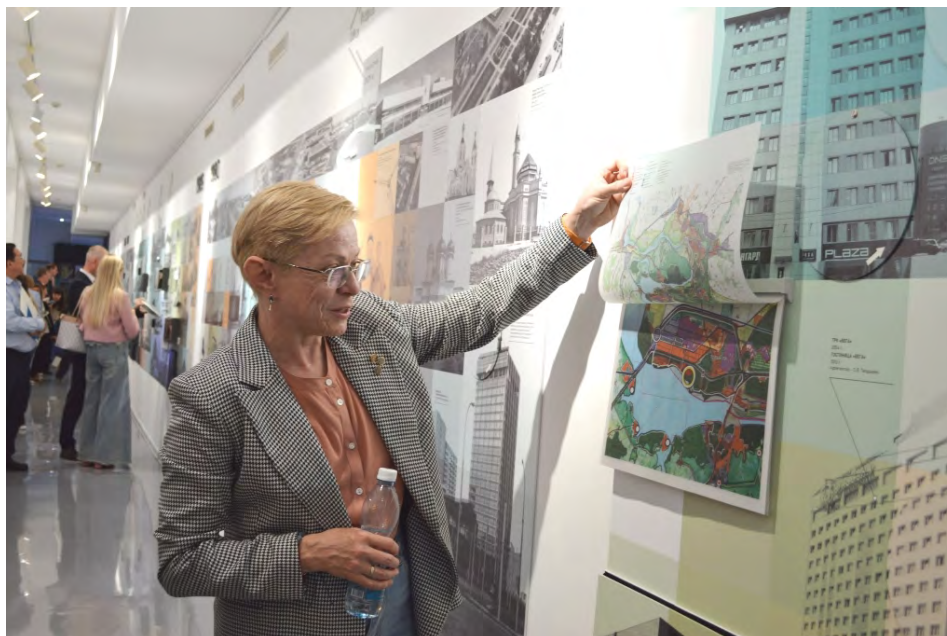
Первые посетители нового экспозиционно-выставочного пространства «Переход»

3. В 2025 году завершена многолетняя работа над постоянной исторической экспозицией «Ставрополь-Тольятти» – открыто новое экспозиционно-выставочное пространство «Переход». Создание нового раздела экспозиции реализовано в рамках проекта-победителя конкурса «#фондпотанина25» при поддержке Благотворительного фонда Владимира Потанина. Главная идея нового пространства – «переход», превращение провинциального Ставрополя в крупный промышленный Тольятти – «Город Будущего». «Переход» – это история смены месторасположения и изменения городского и культурного ландшафтов, история реализованных и нереализованных проектов, переход от провинциальной к столичной архитектуре «Города Мечты». «Переход» – это трансформация горожанина, культурной и социальной жизни всего города.